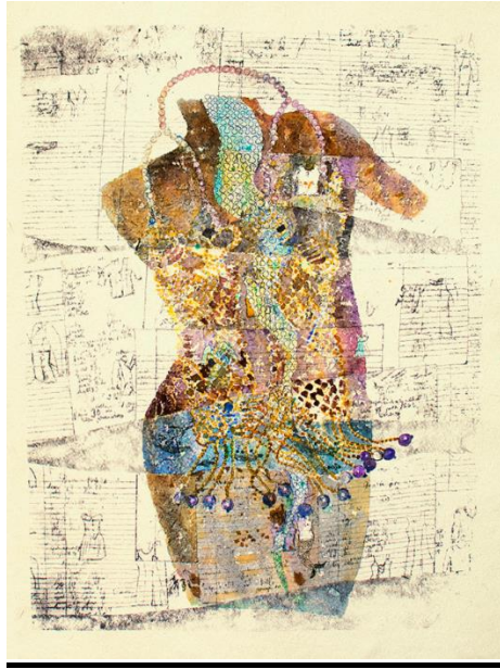
“Cuerpo vestido” 0.75 x 0.55 cm. Serigrafía intervenida con acuarela y tintes naturales en papel de algodón (300 gr.)